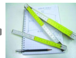
rilevamento metrico e fotografico