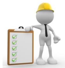
sopralluogo presso il cliente